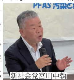
新社会党宮川中執

「PFAS 汚染と都政を考えるついで part II」が6月7日立川市で行われた。「Chance 都政！PFAS 対策を！」をテーマに都知事選予定候補者（メッセージ）と野党6政党、市民が挨拶。「多摩地域のPFASを明らかに都知事選の焦点に！」声を上げた！！