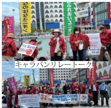
キャラバンリレートーク

た。大手企業で賃上げがされても、非正規雇用労働者には波及されていない。最賃こそが生活を支える根幹となっている。