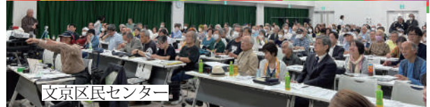
文京区民センター